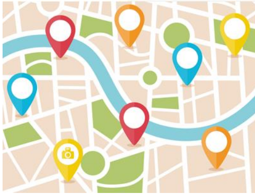
Slika 2: Primjer oznaka Geo-tagiranja

Učenici će u okviru nastavnih aktivnosti dizajnirati geolokacijske oznake za vrstu eko spremnika koja bi svojim dizajnom i bojom upućivala na mjesto i vrstu spremnika, ali i drugih mogućih nepoželjnih odlagališta otpada u okviru kvarta. U realnom vremenu učenici bi dodavali i opisivali prikupljene i obrađene podatke (geo-tagiranje) te pružali zajednici ažurne informacije iz zajedničkog ekosustava. Građani bi imali uvid u prikupljene podatke kroz web korsički aplikacije i mobilnu aplikaciju #ekokvart.