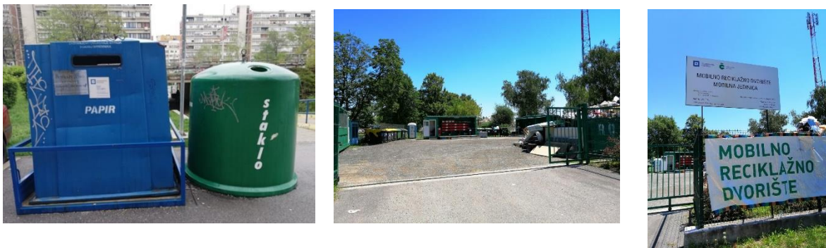
Slika 4: Spremnici i reciklažno dvorište